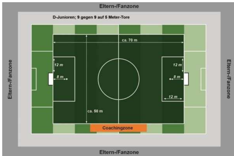
C-Juniorinnen Feld identisch mit D-Juniorinnen (9er)

Bei einer Mindestbreite von 70 Metern kann innerhalb in einer Platzhälfte gespielt werden. Dabei dient die Verlängerung des 5m-Torraumes als Seitenlinie