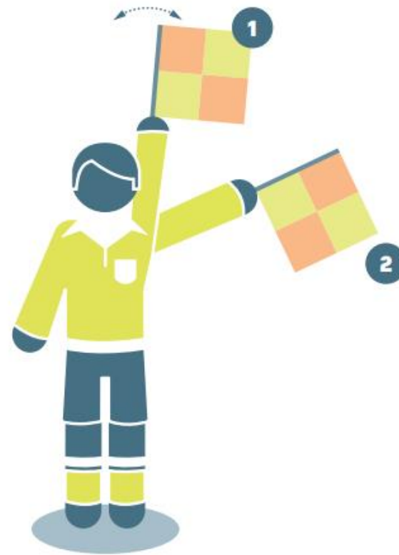
Freistoß für das verteidigende Team