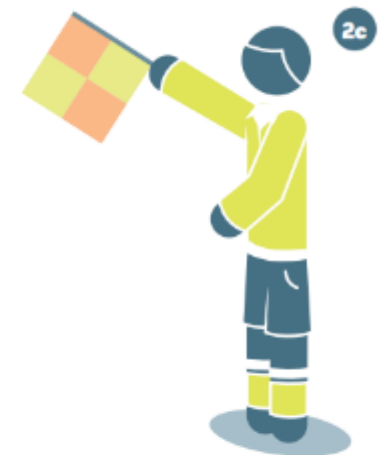
Abseits auf der entferneren Seite des Spielfelds