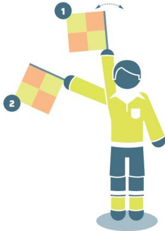
Freistoß für das angreifende Team