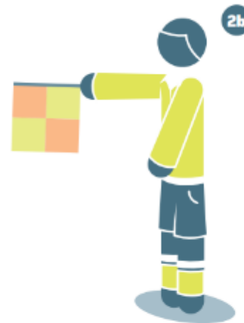
Abseits in der Mitte des Spielfelds