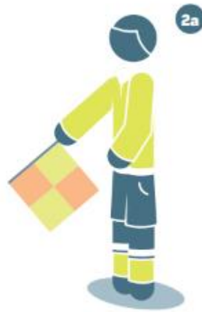
Abseits auf der näheren Seite des Spielfelds